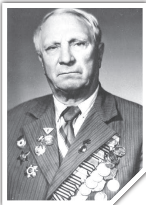
КАРПОВ ПАВЕЛ АЛЕКСЕЕВИЧ

Сегодня на воркутинской школе № 23 установлена мемориальная доска в его честь. Установка этого памятного знака в 2016 году стала символом уважения к герою и образом патриотизма для молодого поколения.