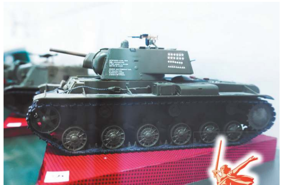
Экспозиция в Воркутинском музейно-выставочном центре, посвященная танковой колонне «Шахтер Воркуты»