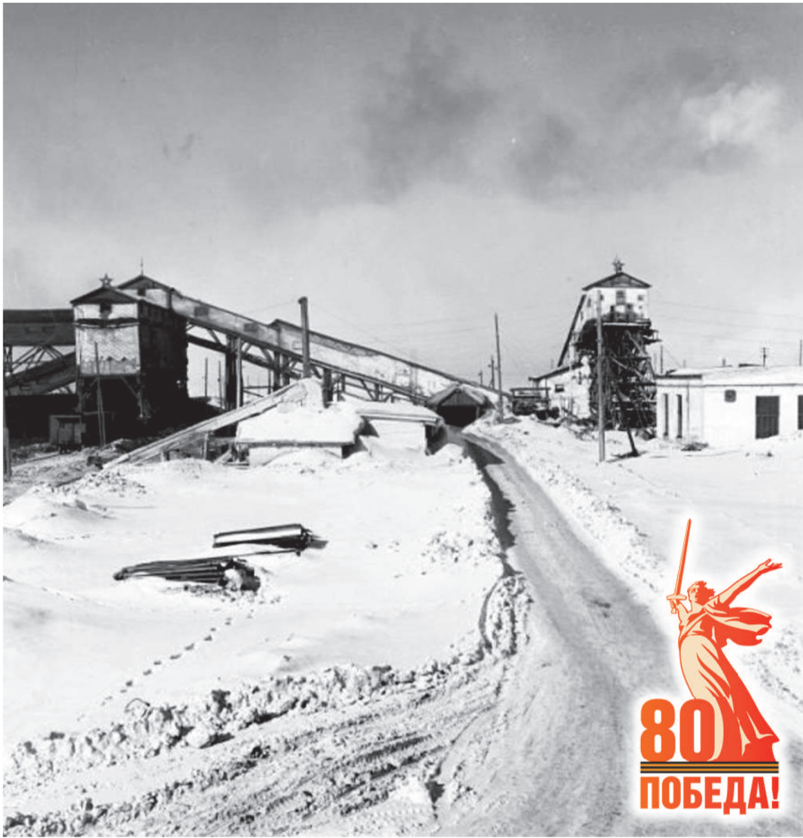
Фотонегатив «Шахта № 5» из фондов Воркутинского музейно-выставочного центра, автор Я. Я. Вундер, 1960-е годы