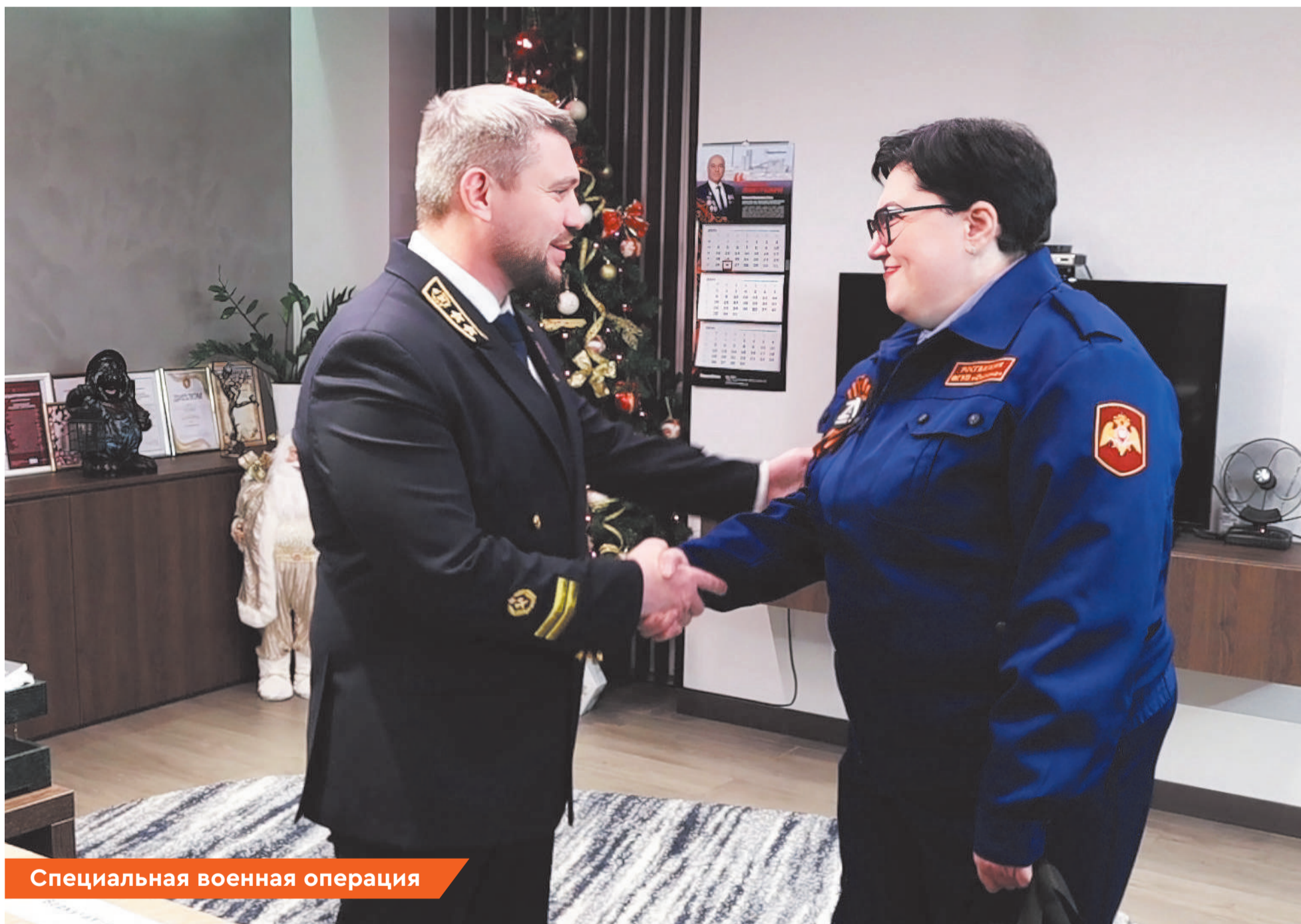
Специальная военная операция