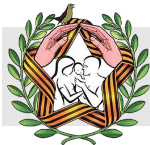
Курская региональная общественная организация «Матери Курского края»

Прожиточный минимум в Республике Коми в 2025 году прибавит около двух тысяч рублей. В северной части региона, куда входит Воркута, для трудоспособного населения он составит 25 852 рубля, для пенсионеров – 20 397 рублей, для детей – 23 081.