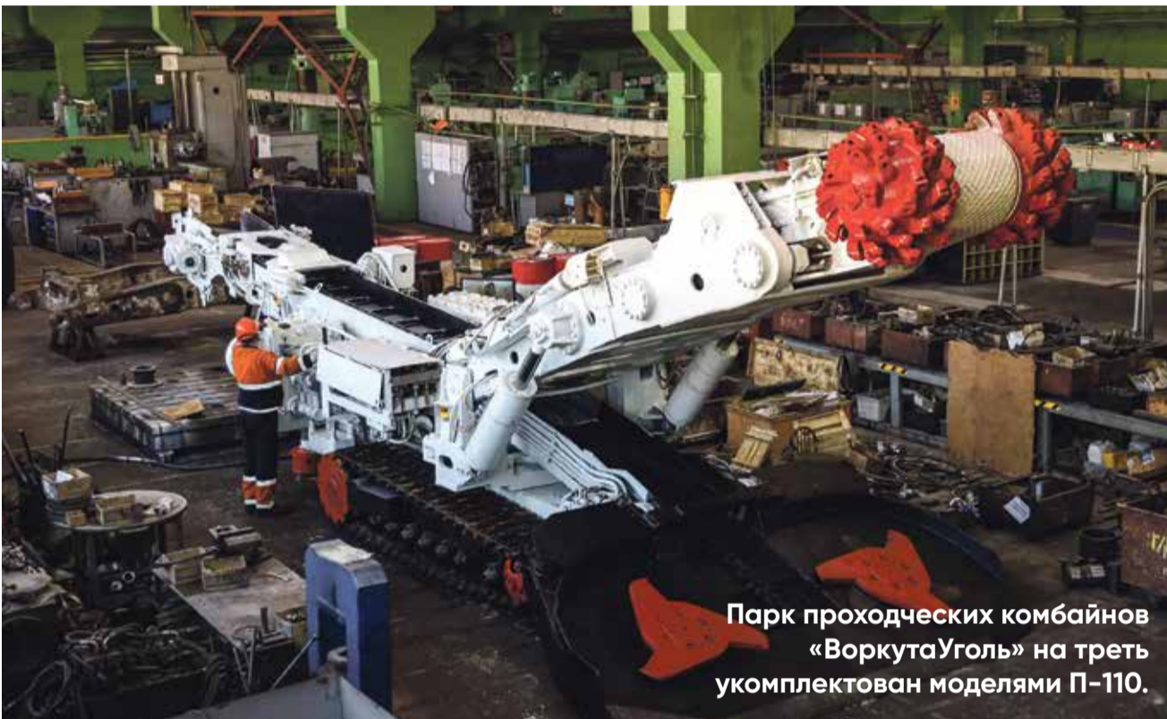
Парк проходческих комбайнов «ВоркутаУголь» на треть укомплектован моделями П-110.

Для «лечения» решили «пересадить» комбайн П-110 на комплектующие модели КП-21 производства российского предприятия по выпуску горно-шахтного оборудования «Ильма». Компания более 10 лет занимается проектированием и выпуском систем электрогидравлического управления для модернизации и ремонта проходческих комбайнов КП-21. Более того, в Воркуте есть представительство «Ильмы», специалисты которого обеспечивают сервисное обслуживание оборудования и имеют склад запчастей.