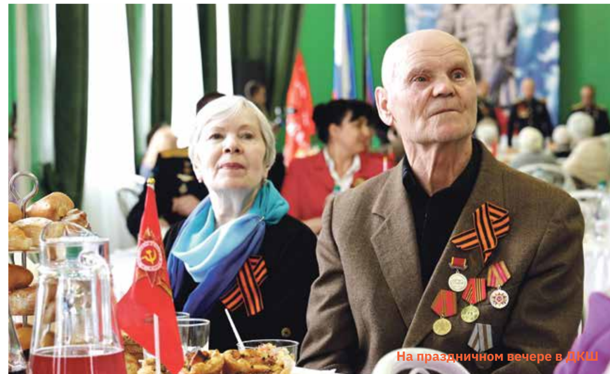
На праздничном вечере в ДКШ

миллиона тонн угля добыли шахтеры Воркуты за пять военных лет.