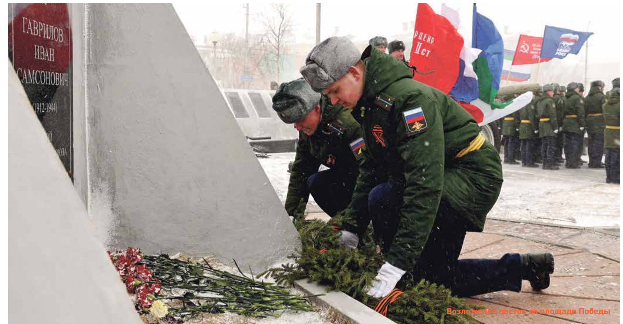
Возложение цветов на площади Победы

В преддверии Дня Победы представители компании «ВоркутаУголь» навестили ветеранов Великой Отечественной. Этим людям выпала нелегкая доля – их детство пришлось на страшные годы войны, свою молодость они посвятили строительству и развитию заполярного города, который стал для них родным. Сотрудники угледобывающей компании вручили подарки и поблагодарили за стойкость, многолетний труд и верность единой избранному профессиональному пути.