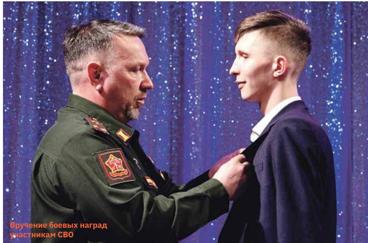
Вручение боевых наград участникам СВО

В ГОДЫ ВОЙНЫ ЧЕРЕЗ ВОРКУТУ ПРОТЯНУЛАСЬ ЛИНИЯ ТРУДОВОГО ФРОНТА, НА КОТОРОМ БЕЗ УСТАЛИ НА БЛАГО СТРАНЫ И ВО ИМЯ ВЕЛИКОЙ ПОБЕДЫ УПОРНО РАБОТАЛА МУЖЕСТВЕННАЯ ГВАРДИЯ ШАХТЕРОВ. СПУСТЯ 79 ЛЕТ КОМПАНИЯ «ВОРКУТАУГОЛЬ» ОТДАЛА ДАТЬ УВАЖЕНИЯ СЛАВНОЙ ИСТОРИИ ЗАПОЛЯРНОГО ГОРОДА И УГЛЕДОБЫЧИ И ЕЕ ГЕРОЯМ.