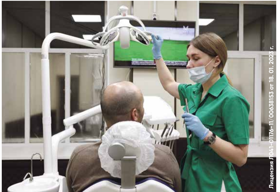
Лицензия Л041-01176-11/00638153 от 18. 01. 2023 г.