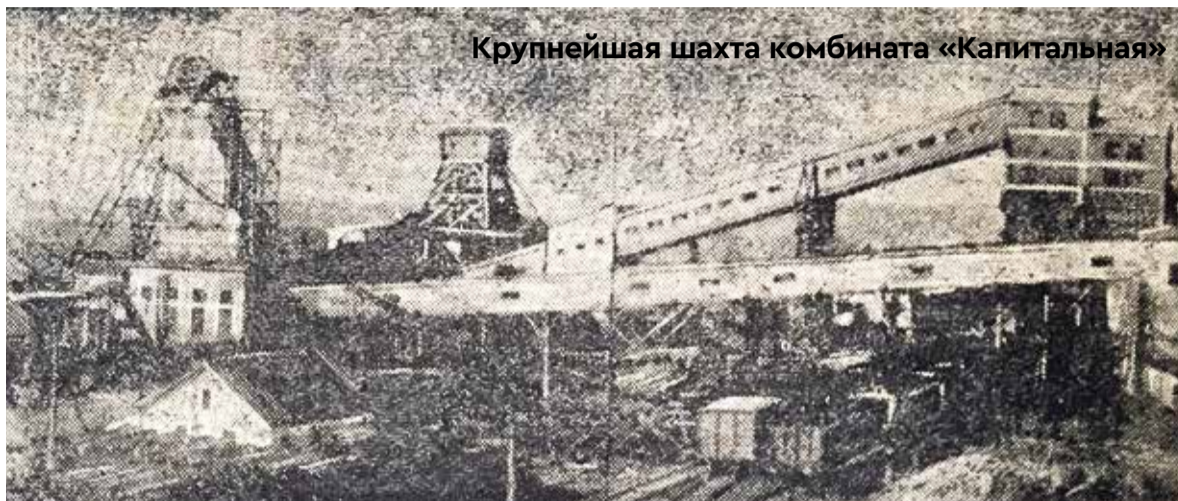
Крупнейшая шахта комбината «Капитальная»