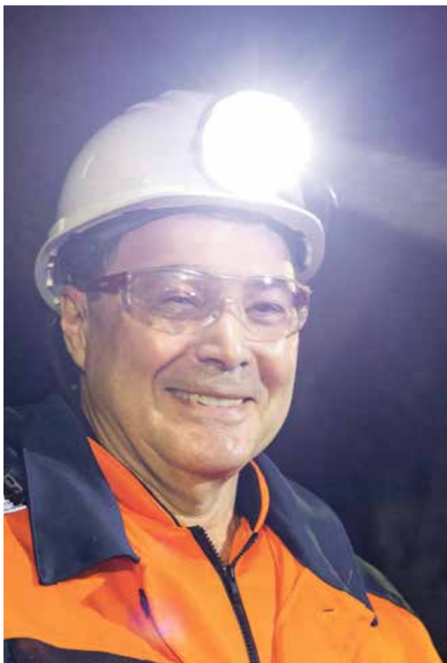
Сделано фотоаппаратом во взрывобезопасном исполнении

– Я рад за мой родной город, рад, что в нем происходят изменения к лучшему. Пусть так будет и дальше. Живи и развивайся, Воркута – любовь моя! – пожелал президент Торгово-промышленной палаты Коми.