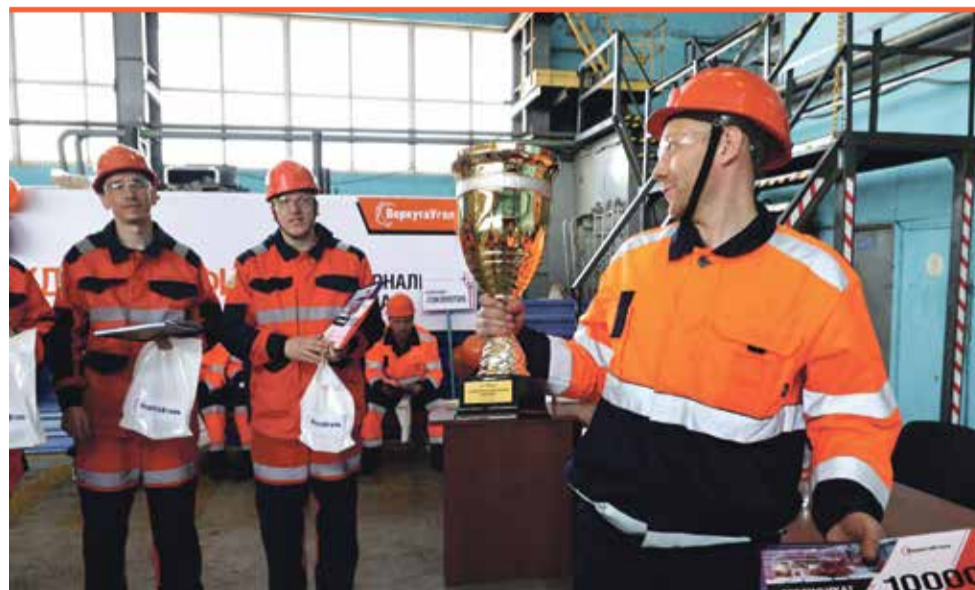
Победный кубок у команды «ЖД-спецназ»