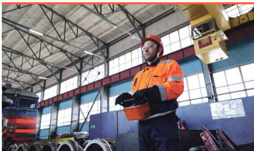
Управление подъемным краном требует опыта

Завершились профессиональные соревнования конкурсом капитанов. За десять минут они должны были разгадать максимальное количество слов в тематическом кроссворде. По итогам всех испытаний с минимальным перевесом победили сотрудники участка ремонта железнодорожной техники ВТП. Все конкурсанты получили в награду ценные призы от «ВоркутаУголь» и денежные сертификаты, а команда-победитель – чемпионский кубок.